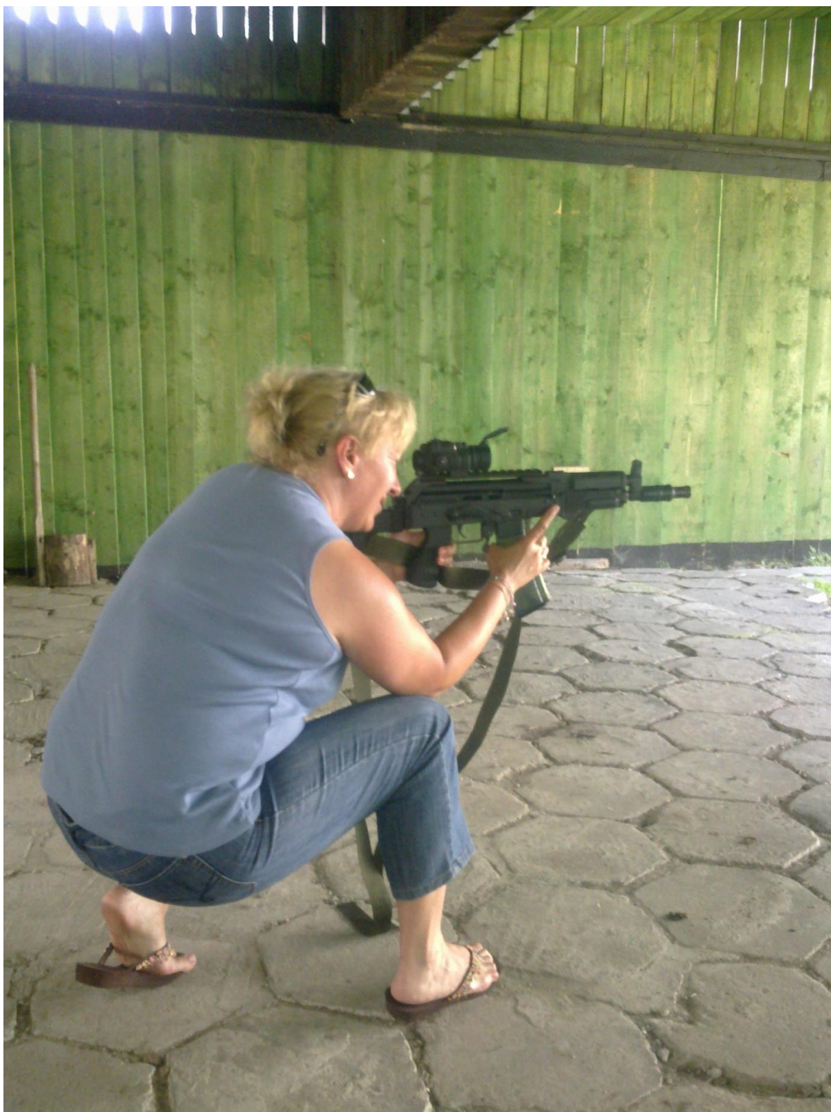
Strzelnica Pasternik – Turniej Strzelecki dla nauczycieli PO