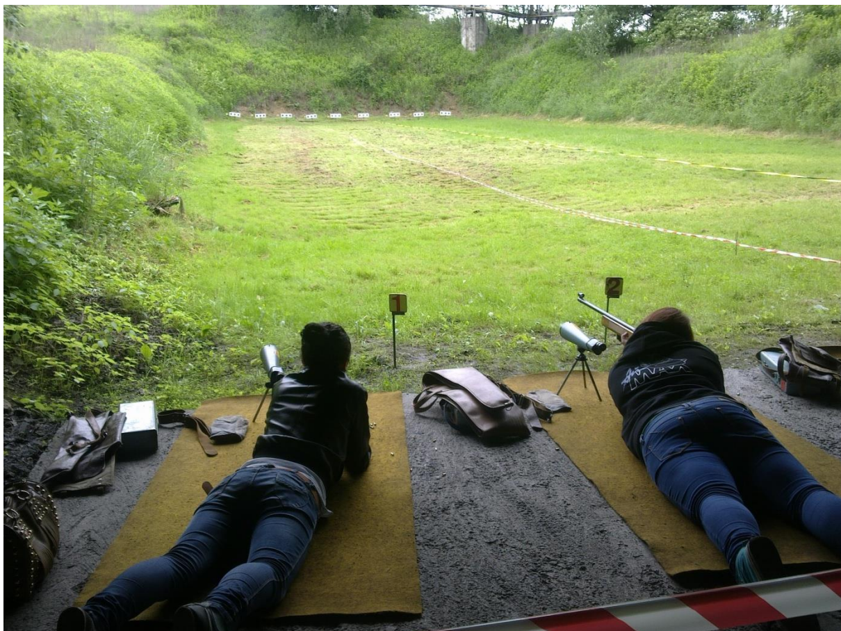
Strzelnica Pleszów – IV etap Międzypowiatowej Ligi Strzeleckiej