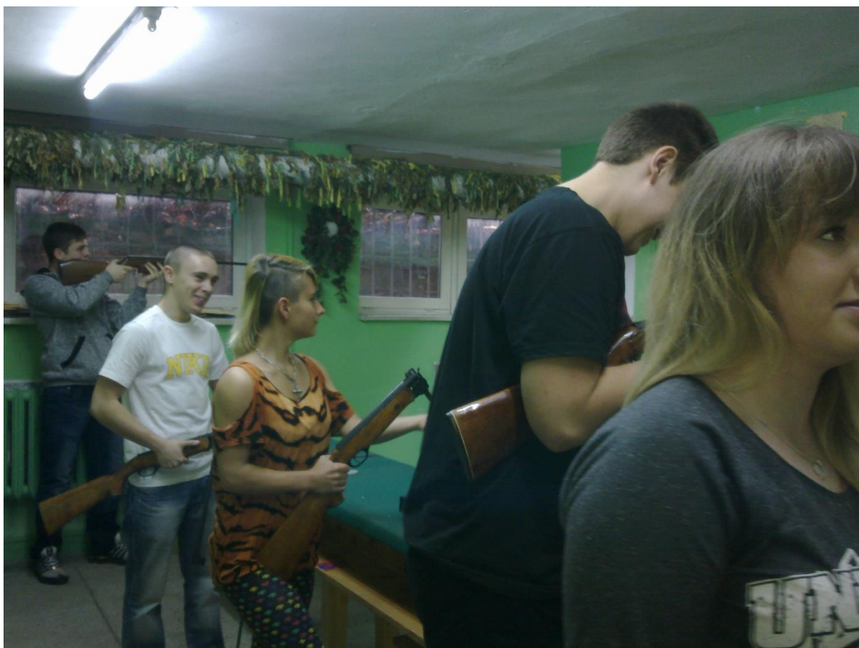
Międzyklasowy Turniej Strzelecki