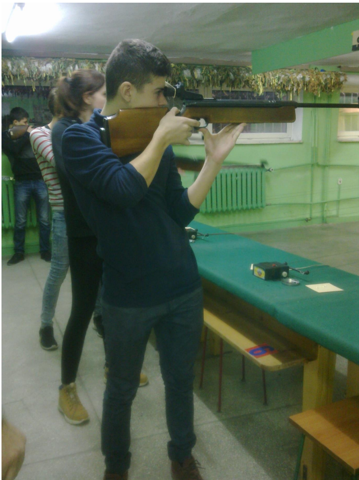
Strzelnica LOK- II etap Ligi Strzeleckiej- karabin Chenel