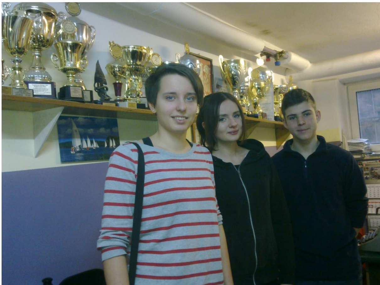
Reprezentacja Szkoły na Międzypowiatową Ligę Strzelecką 20015/16